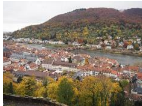
ハイデルベルグ城から見た美しい街