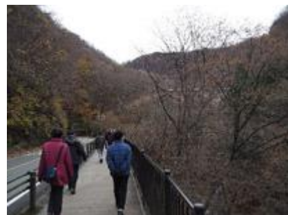
めぐね橋に向かう参加者