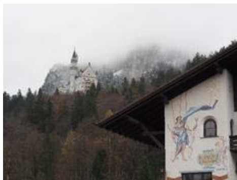
霧に霞むノイシュバンシュタイン城

木組みの家が建ち並ぶディンケルスビュールはメルヘンの世界。中世の宝石箱ローテンブルクでの晚餐と早朝散歩、ハイデルベルク城からのネットワーク沿いの美しい街の眺めを楽しむ、ロマンチック旅を終えた。