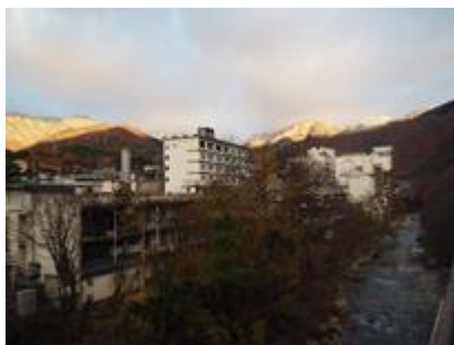
宿舎から見た朝焼けの谷川岳方面